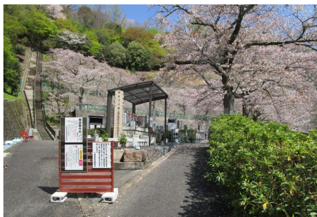
三界万霊塔と六体地藏尊 毎月1回法要をしております

◇随時、ご説明・ご案内させていただきます。（※お電話によるお申し込みは出来ません）